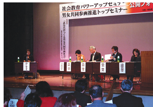
「男女共同参画推進トップセミナー公開フォーラム」シンポジウムのようす