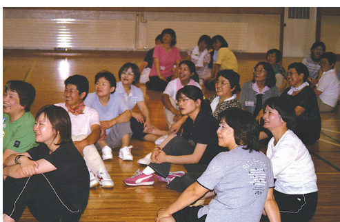
社会教育パワーアップセミナーでのアイスブレイキングのようす

県主催の各種研修会修了生や社会教育関係者を対象に、専門的な研修を通してさらなる資質の向上を図り、地域におけるまちづくりや青少年の育成、人権問題など現代的な課題について積極的に取り組む人材を育成する。